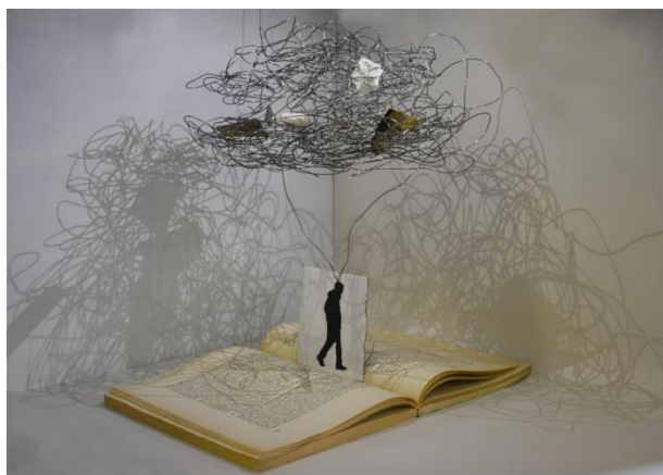
misure: 60 x 60 x h 63